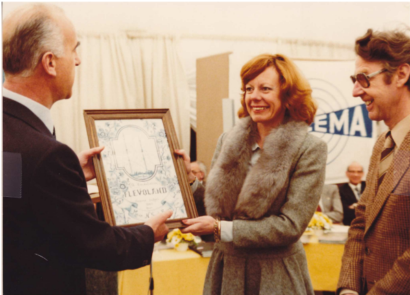
Opening MG zendstation Flevoland in 1980

In de vorige Nieuwsbrief zijn de 8 hoofdstukken al vermeld.