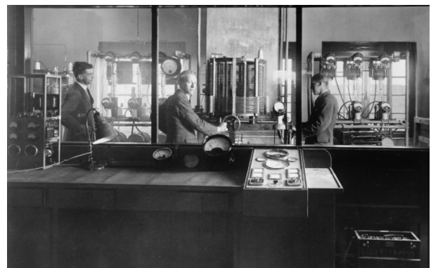
De zender in Huizen wordt afgeregeld

Het gemeentebestuur van Huizen (N.H.) heeft na het indienen van het nieuwe bouwplan voor den radiozender aldaar zooveel medewerking verleend, dat heden, Maandag, reeds kon begonnen worden met de uitvoering. De firma De Vries Robbé te Gorinchem, de leverancierster der radiomasten welke in de constructiewerkplaatsen reeds gereed liggen, begint dan met het maken van de betonfundering, terwijl ook met het bouwen van het zendgebouwtje wordt begonnen.